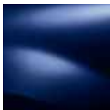
BLEU MARINE 61H (OV)